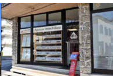
ZERO BRANCO piazza Umberto I, 5 zerobranco@domus-nova.net